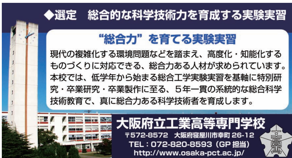
図2-1 本取組のコピー（環境都市システムコース山野講師デザイン）

本取組を一言で表現すると「“総合力”を育てる実験実習」となります。これを本校教育GPのキャッチコピーとし、さらに、本取組の概要を端的に要約して、『現代の複雑化する環境問題などを踏まえ、高度化・知能化するものづくりに対応できる、総合力ある人材が求められています。本校では、低学年から始まる総合工学実験実習を基軸に特別研究・卒業研究・卒業製作に至る、5年一貫の系統的な総合科学技術教育で、真に総合力ある科学技術者を育成します。』としました。この要約文と先のキャッチコピーに本校のシンボルである時計塔と専門棟をバックにした背景をつけたコピー（図2-1）のように表現しました。このコピーは、平成21年10月27日発刊の「週刊朝日」の文科省教育GP特集ページに掲載されています。